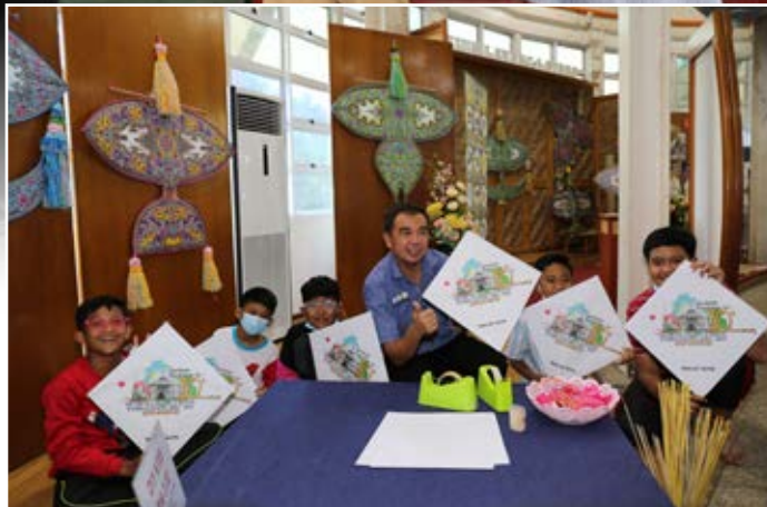
Yang Berhormat bersama pengunjung kanak-kanak di Muzium Layang-Layang Pasir Gudang.