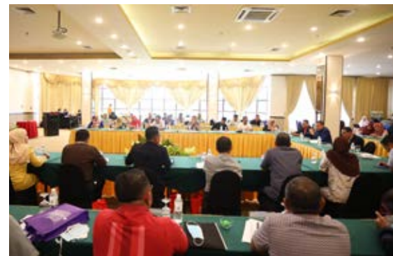
Yang Dipertua turut serta dalam sesi taklimat dan sesi lawatan lokasi program.