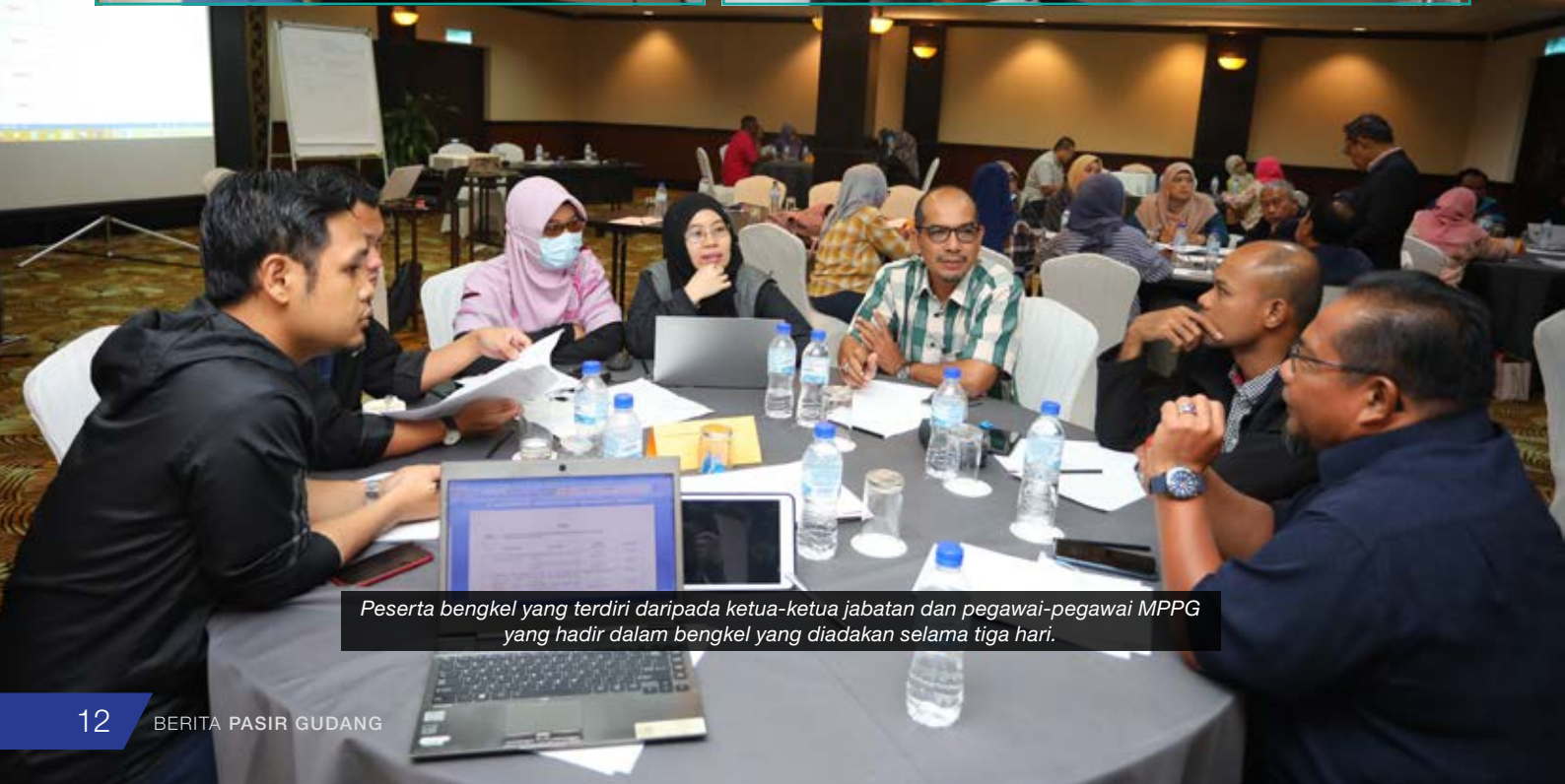
Peserta bengkel yang terdiri daripada ketua-ketua jabatan dan pegawai-pegawai MPPG yang hadir dalam bengkel yang diadakan selama tiga hari.