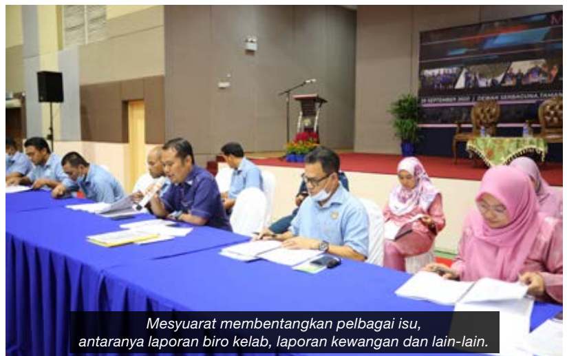
Mesyuarat membentangkan pelbagai isu, antaranya laporan biro kelab, laporan kewangan dan lain-lain.

Sesi mesyuarat berakhir dengan acara cabutan bertuah. Cabutan diadakan dengan lebih 30 hadiah-hadiah menarik disediakan untuk ahli yang hadir.