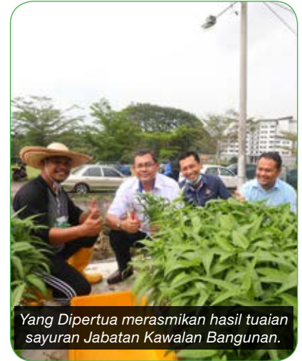
Yang Dipertua merasmikan hasil tuaian sayuran Jabatan Kawalan Bangunan.