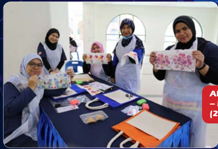
AKTIVITI BIRO WANITA KSK MPPG – MEMBUAT TAMPALAN DEKOR BAG (23/9/2020)