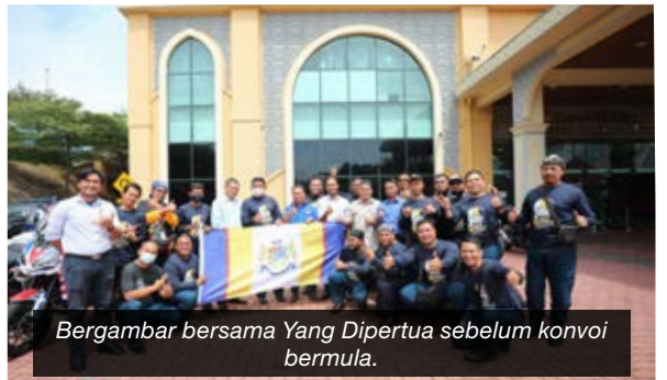
Bergambar bersama Yang Dipertua sebelum konvoi bermula.

MAJLIS PERBANDARAN PASIR GUDANG telah kehilangan dua orang warga kerja yang telah kembali ke rahmatullah tanggal Jun dan Oktober yang lalu.