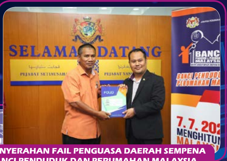
PENYERAHAN FAIL PENGUSAH DAERAH SEMPENA BANGI PENDUDUK DAN PERUMAHAN MALAYSIA 2020 (7/9/2020)