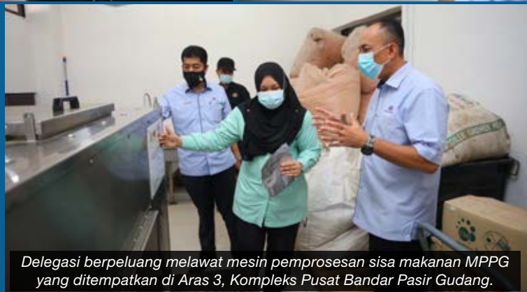
Delegasi berpeluang melawat mesin pemprosesan sisa makanan MPPG yang ditempatkan di Aras 3, Kompleks Pusat Bandar Pasir Gudang.

MPPG TELAH MENERIMA LAWATAN dari Johor Land Berhad pada 13 September yang lalu. Johor Land sedang membangunkan satu hub makanan, Riverside@BDO yang terletak di Bandar Dato' Onn dan sedang mengkaji cara terbaik bagi menguruskan pembuangan sisa makanan di tapak projek tersebut. Sehubungan itu, lawatan ke MPPG ini adalah bagi menimba ilmu serta mendapatkan pendedahan mengenai proses pengurusan sisa makanan. Jabatan Kesihatan Awam MPPG merupakan jabatan yang terlibat dalam menguruskan pemprosesan sisa makanan.