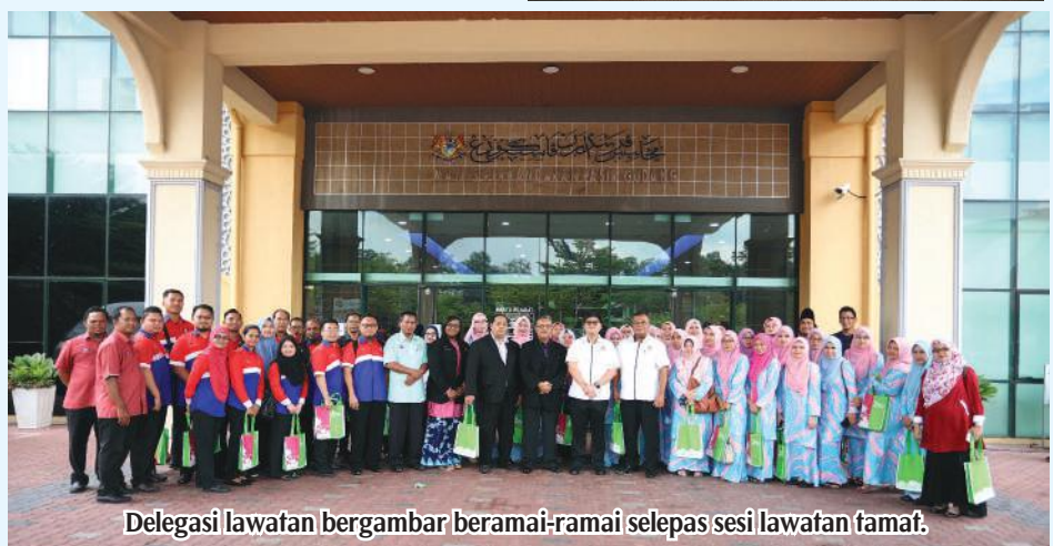
Delegasi lawatan bergambar beramai-ramai selepas sesi lawatan tamat.