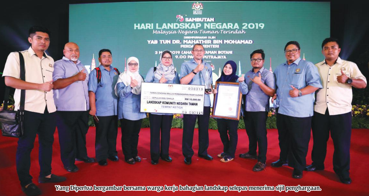
Yang Dipertua bergambar bersama warga kerja bahagian landskap selepas menerima sijil penghargaan.

Dalam menjadikan Pasir Gudang indah, selesa dan selamat untuk di diami. MPPG melalui Bahagian Landskap telah menyediakan kemudahan-kemudahan landskap di setiap taman kejiranan yang wujud di dalam pentadbiran MPPG. Ia juga bertujuan bagi mencapai sasaran visi MPPG bagi menjadikan Pasir Gudang Bandar Industri Sejahtera dan Tersohor. Antara objektif Bahagian Landskap dalam meneraju fokus keindahan dan keceriaan landskap di Pasir Gudang adalah memastikan segala pembangunan landskap yang dilaksanakan mengikut perancangan yang telah ditetapkan mengikut piawaian negara, membangunkan kawasan hijau Pasir Gudang dengan rekabentuk dan pengisian yang praktikal, berfungsi selamat, selesa dan menarik sebagai sebuah kawasan riadah untuk komuniti didalam kawasan Pentadbiran MPPG. Selain itu, mewujudkan jalinan hijau ( green network ) yang menghubungkan pusat kediaman, pusat komersial dan kawasan industri dengan mengambil kira ciri-ciri utama bandar selamat. Dan memperkenalkan Pasir Gudang dengan landskap yang menarik selari dengan pengiktirafan destinasi wilayah selatan semenanjung yang mempunyai keunikan tersendiri.