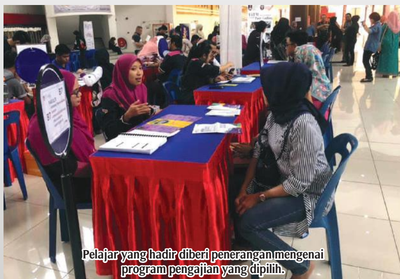
Pelajar yang hadir diberi penerangan mengenai program pengajian yang dipilih.

Hampir 3000 pengunjung yang hadir bagi mendapatkan maklumat lanjut berkenaan program anjuran UiTM Pasir Gudang ini. Program berlangsung dari jam 9.00 pagi hingga 4.30 petang