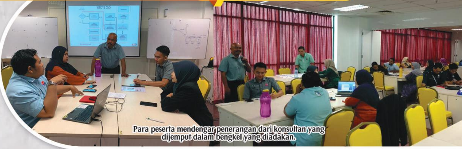
Para peserta mendengar penerangan dari konsultan yang dijemput dalam bengkel yang diadakan.