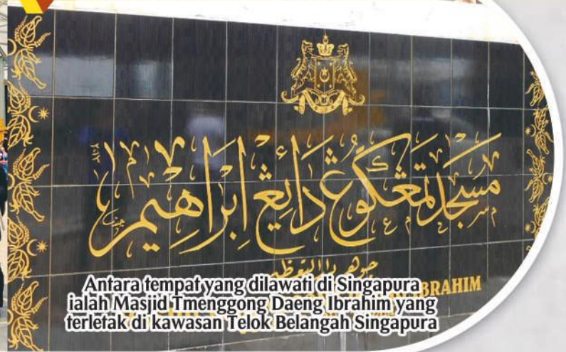
Antara tempat yang dilawati di Singapura ialah Masjid Menggong Daeng Ibrahim yang terletak di kawasan Telok Belangah Singapura