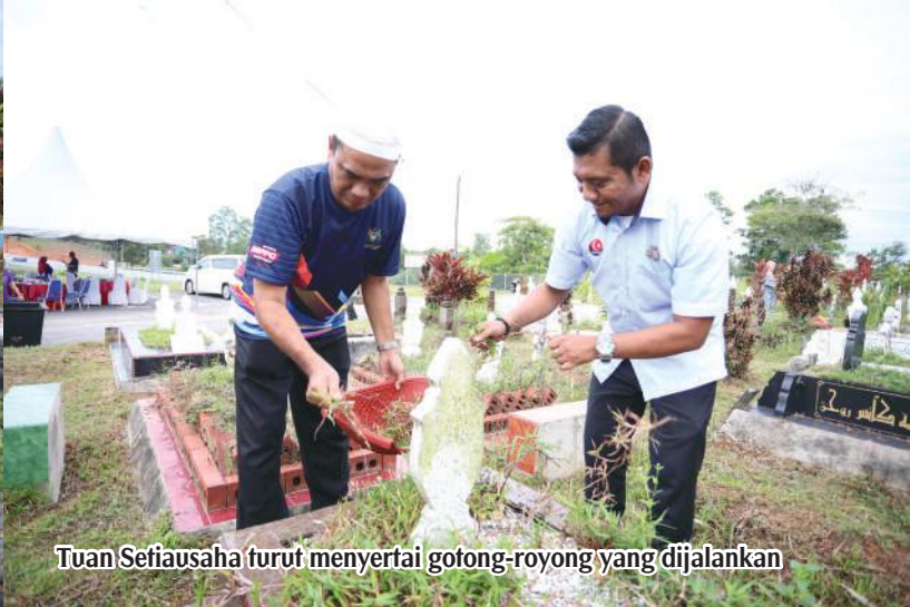
Tuan Setiausaha turut menyertai gotong-royong yang dijalankan