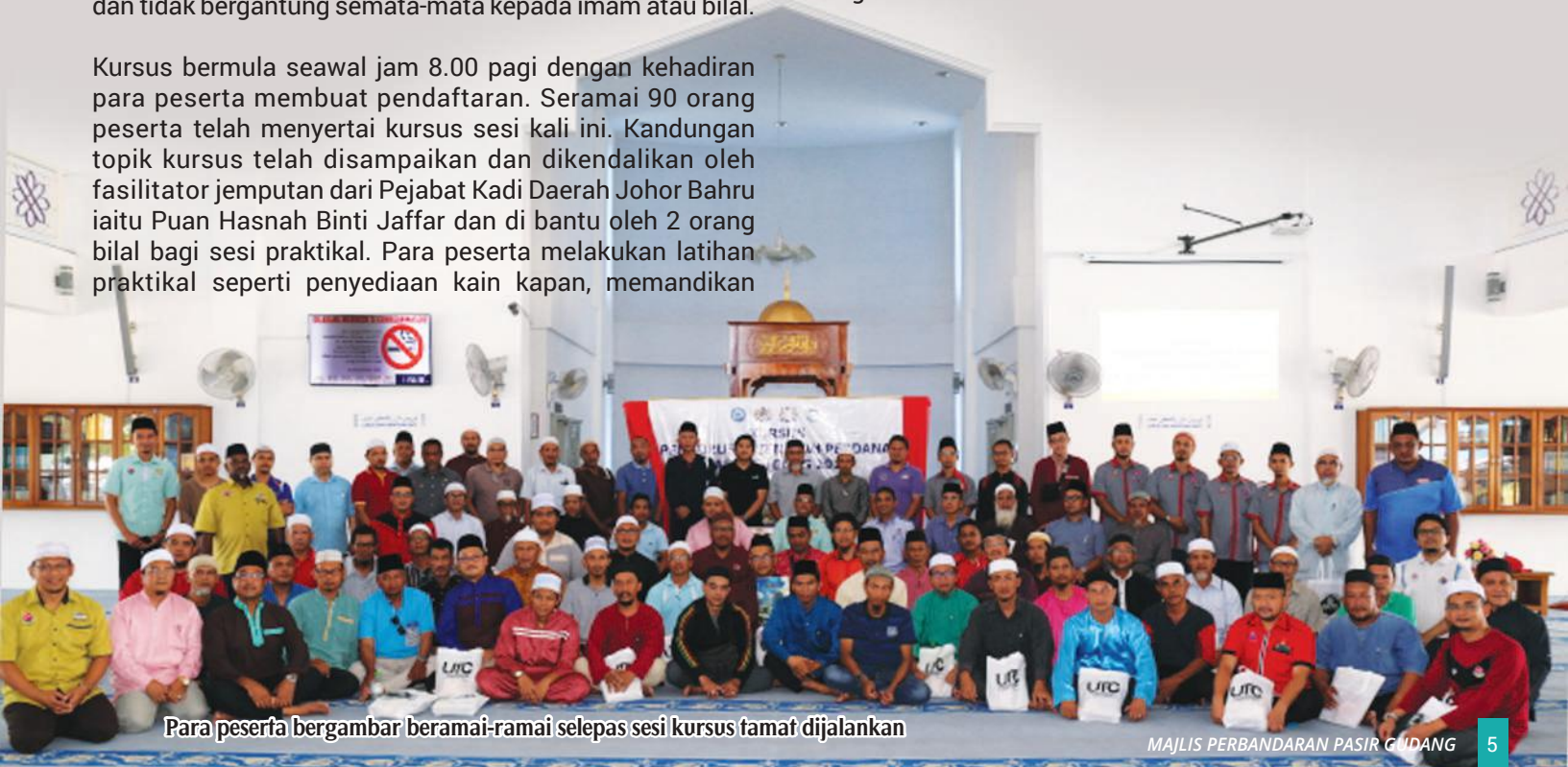
Para peserta bergambar beramai-ramai selepas sesi kursus tamat dijalankan

Kursus bermula seawal jam 8.00 pagi dengan kehadiran para peserta membuat pendaftaran. Seramai 90 orang peserta telah menyertai kursus sesi kali ini. Kandungan topik kursus telah disampaikan dan dikendalikan oleh fasilitator jemputan dari Pejabat Kadi Daerah Johor Bahru iaitu Puan Hasnah Binti Jaffar dan di bantu oleh 2 orang bilal bagi sesi praktikal. Para peserta melakukan latihan praktikal seperti penyediaan kain kapan, memandikan