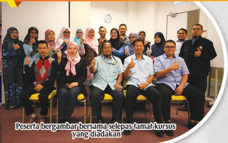
Peserta bergambar bersama selepas tamat kursus yang diadakan