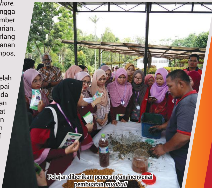
Pelajar diberikan penerangan mengenai pembuatan mudball