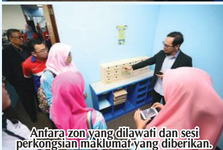
Antara zon yang dilawati dan sesi perkongsian maklumat yang diberikan.