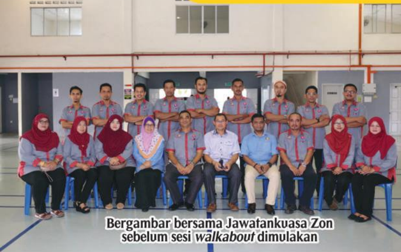
Bergambar bersama Jawatankuasa Zon sebelum sesi walkabout dimulakan

PROGRAM WALKABOUT YDP DI ZON KOTA MASAI 2 DAN 3