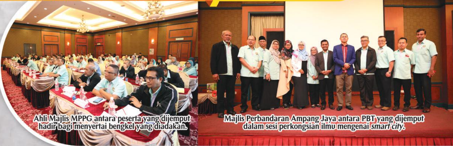
Ahli Majlis MPPG antara peserta yang dijemput hadir bagi menyertai bengkel yang diadakan.