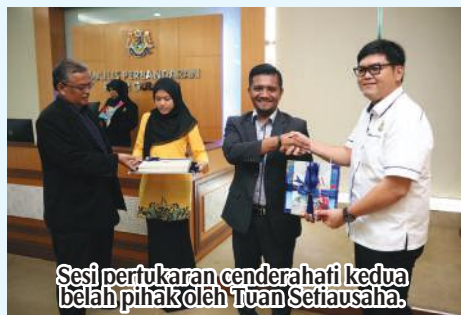
Sesi pertukaran cenderahati kedua belah pihak oleh Tuan Setiausaha.

Semoga lawatan yang dianjurkan ini, mampu memberi sedikit pengetahuan dan perkongsian kepada pihak MDKT mengenai pendedahan dan program EKSA yang dijalankan.