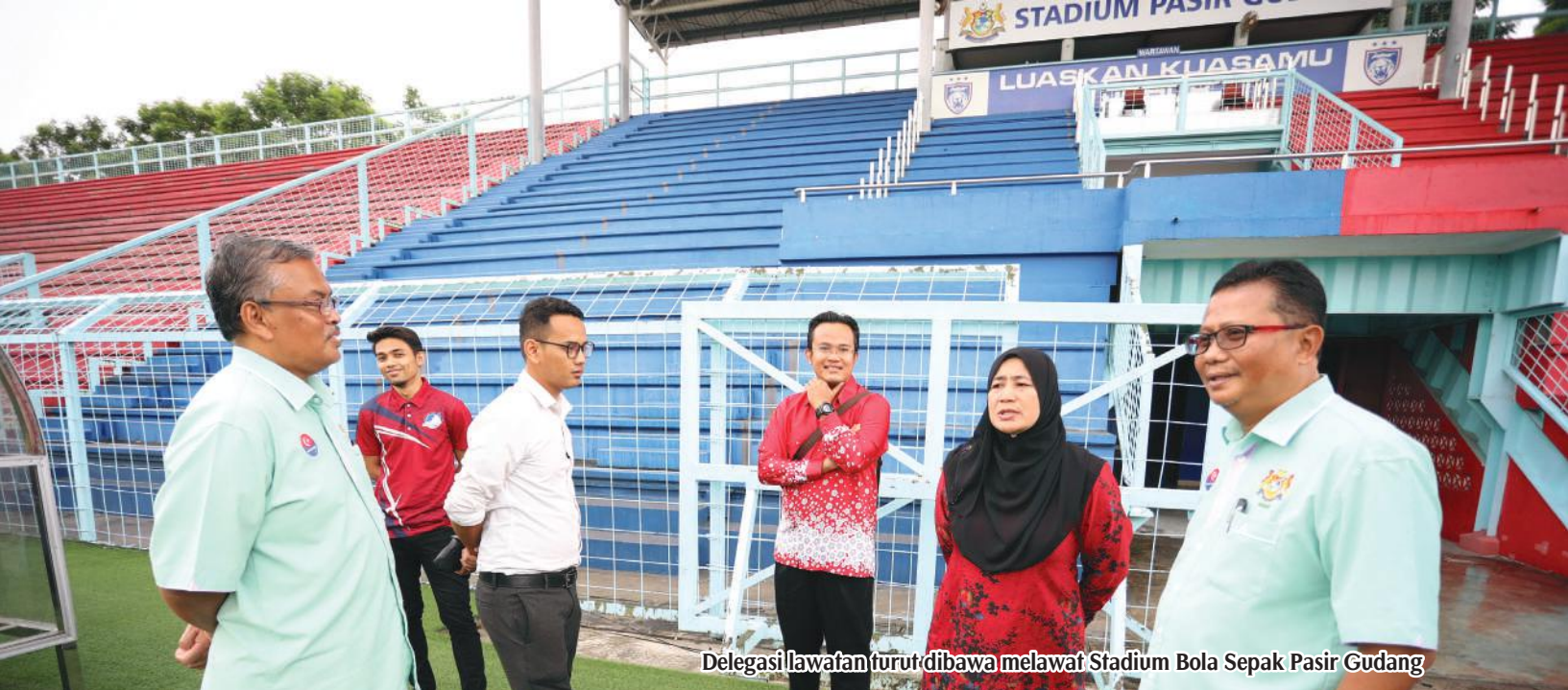
Delegasi lawatan turut dibawa melawat Stadium Bola Sepak Pasir Gudang