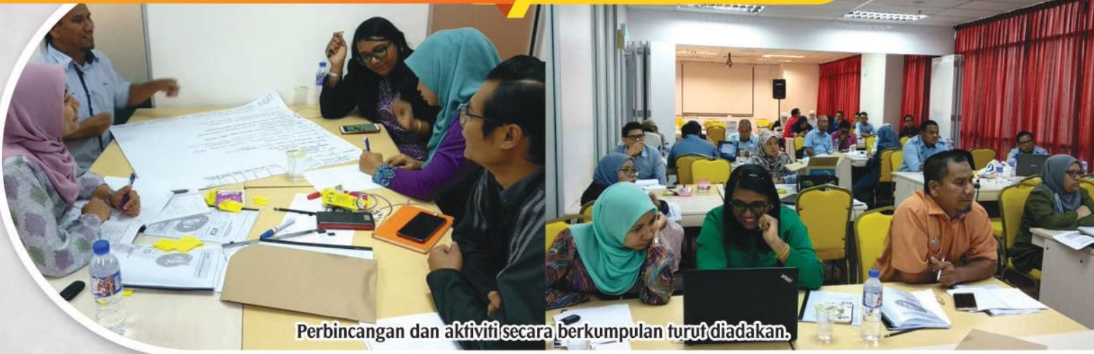
Perbincangan dan aktiviti secara berkumpulan turut diadakan.