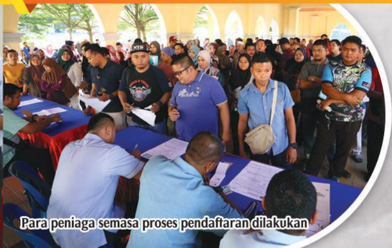
Para peniaga semasa proses pendaftaran dilakukan