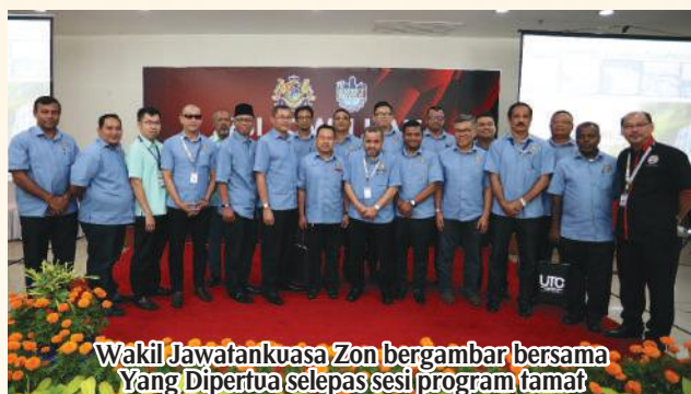
Wakil Jawatankuasa Zon bergambar bersama Yang Dipertua selepas sesi program tamat

Semoga perkongsian idea dan maklumat yang diperolehi dapat dijadikan sebagai satu lagi usaha bagi memperkukuhkan dan mengeratkan lagi perhubungan baik antara MPPG sebagai pentadbir Pasir Gudang dengan pelbagai lapisan masyarakat di bawah pentadbirannya.