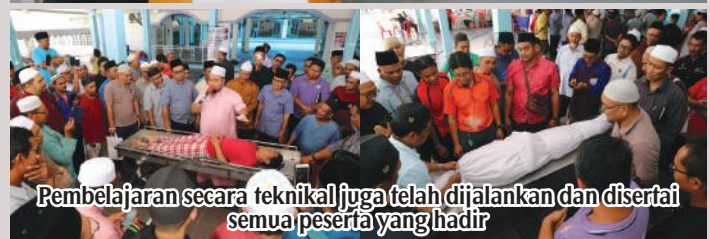
Pembelajaran secara teknikal juga telah dijalankan dan disertai semua peserta yang hadir

Majlis Perbandaran Pasir Gudang dengan kerjasama jawatankuasa zon penduduk serta surau dan masjid sekitar Pasir Gudang telah menganjurkan program ini pada 17 Mac yang lalu bertempat di Masjid At-Taqwa, Taman Kota Masai.