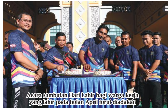
Acara sambutan Hari Lahir bagi warga kerja yang lahir pada bulan April turut diadakan