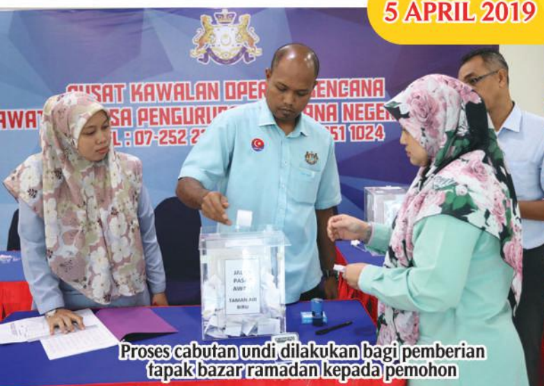
Proses cabutan undi, dilakukan bagi pemberian tapak bazar ramadan kepada pemohon