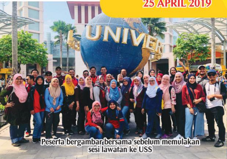
Peserta bergambar bersama sebelum memulakan sesi lawatan ke USS

LAWATAN BIRO SOSIAL KELAB SUKAN DAN KEBAJIKAN (KSK) MPPG KE UNIVERSAL STUDIO SINGAPURA (USS)