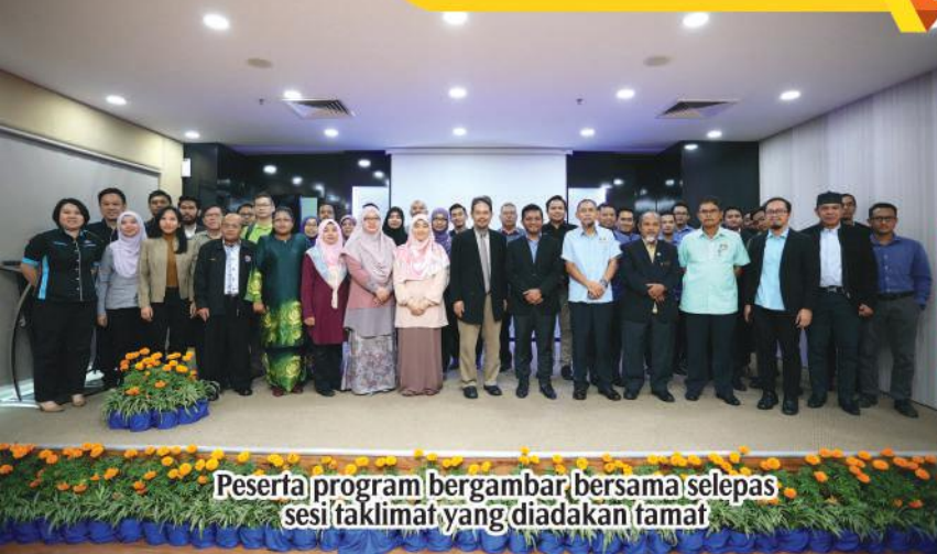
Peserta program bergambar bersama selepas sesi taklimat yang diadakan tamat

BENKEL PENGENALAN SMART CITY DAN BANDAR RENDAH KARBON DI MAJLIS PERBANDARAN PASIR GUDANG