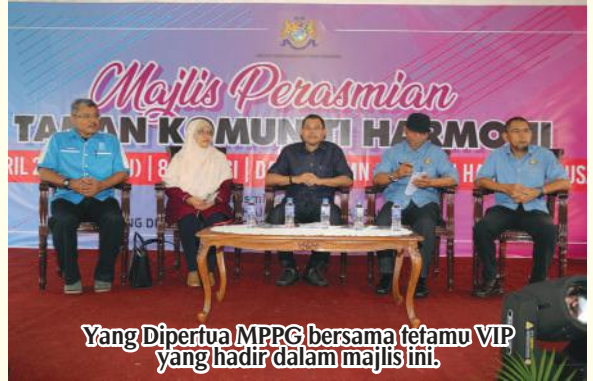
Yang Dipertua MPPG bersama tetamu VIP yang hadir dalam majlis ini.