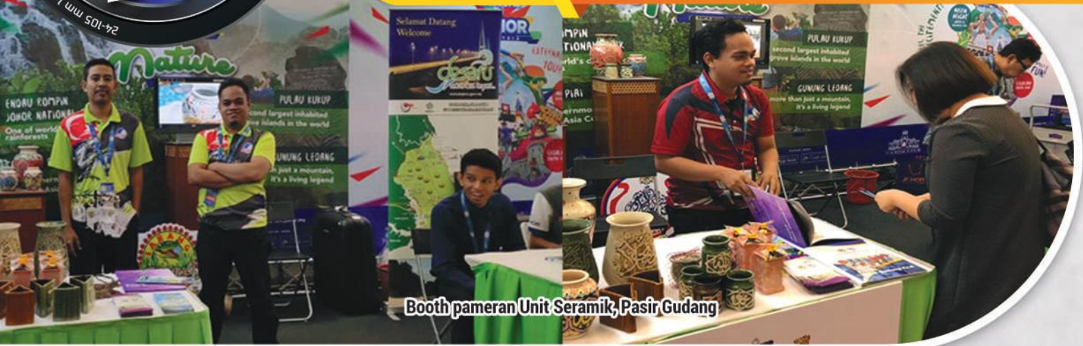
Booth pameran Unit Seramik, Pasir Gudang

PAMERAN FESTIVAL ISLAM ANTARABANGSA DI PERSADA JOHOR BAHRU