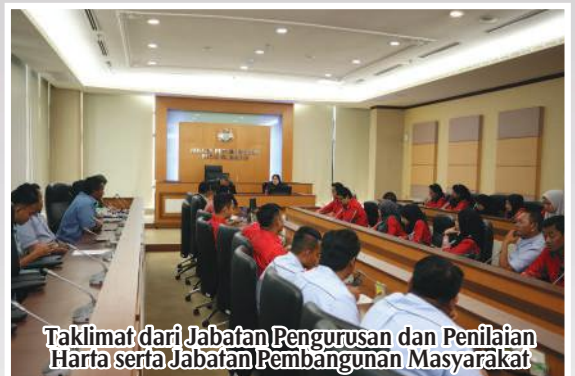
Taklimat dari Jabatan Pengurusan dan Penilaian Harta serta Jabatan Pembangunan Masyarakat

Selepas daripada itu, kunjungan ini telah dibawa melawat Santuari Sarang Buaya Pasir Gudang. Lawatan berakhir dengan jamuan tengahari. Semoga perkongsian ini mampu memberi sedikit banyak info dan maklumat kepada delegasi ini ke MPPG.