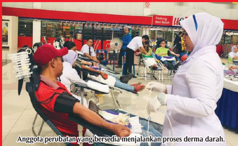
Anggota perubatan yang bersedia menjalankan proses derma darah.

Program yang berlangsung dari jam 10.00 pagi hingga 4.00 petang ini begitu mendapat sambutan yang amat menggalakkan dari warga Pasir Gudang yang dianggarkan disertai lebih 400 orang awam. Selain itu, pengunjung yang hadir dan layak untuk menjalankan proses derma darah akan diberikan cenderahati dari pihak penganjur.