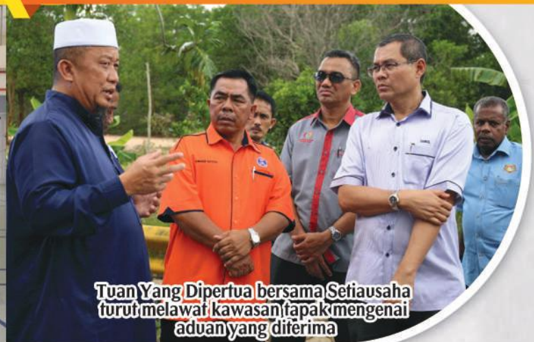
Tuan Yang Dipertua bersama Setiausaha turut melawat kawasan tapak mengenai aduan yang diterima