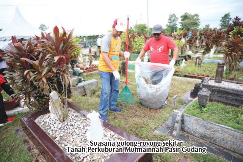
Suasana gotong-royong sekitar Tanah Perkuburan Mufmainnah Pasir Gudang