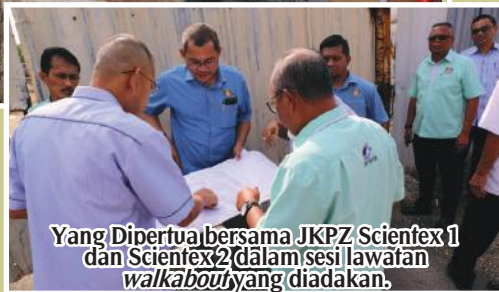
Yang Dipertua bersama JKPZ Scientex 1 dan Scientex 2 dalam sesi lawatan walkabout yang diadakan.