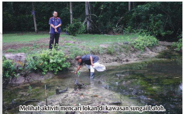
Melihat aktiviti mencari lokan di kawasan sungai Lafoh.

Lawatan bermula di Taman Pertanian Johor seterusnya bergerak ke kawasan pelancongan di Kong-Kong dengan melakukan aktiviti mencari lokan dan singgah ke perusahaan Industri Kecil dan Sederhana (IKS). Lawatan juga dibawa menaiki bot dan bersiar-siar sekitar kawasan pulau. Lawatan berakhir kira-kira jam 2.30 petang selepas sesi lawatan di Sarang Buaya Pasir Gudang dan jamuan tengahari di Restoran Rahmat Kampung Pasir Gudang.