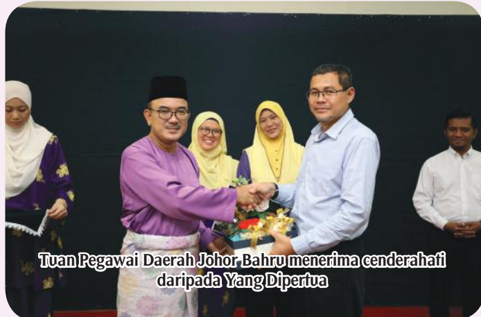
Tuan Pegawai Daerah Johor Bahru menerima cenderahati daripada Yang Dipertua