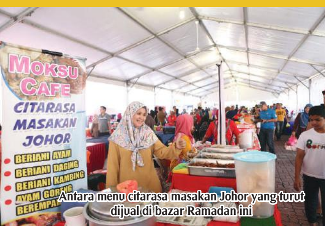
Antara menu citarasa masakan Johor yang turut dijual di bazar Ramadan ini

Seperi tahun-tahun sebelum ini, Pengurusan Kompleks Pusat Bandar (KPBPG) & UTC Pasir Gudang masih meneruskan jualan tapak Bazar Ramadan kepada peniaga-peniaga juadah berbuka puasa sekitar Pasir Gudang.