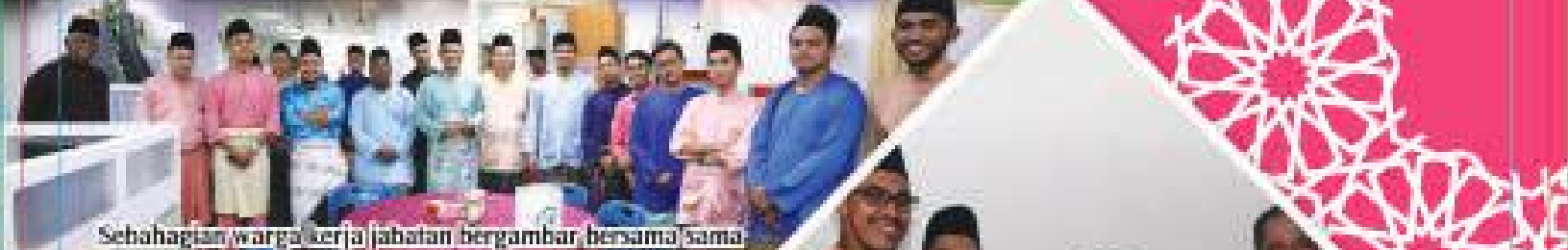
Sebahagian warga kerja jabatan bergambar bersama-sama