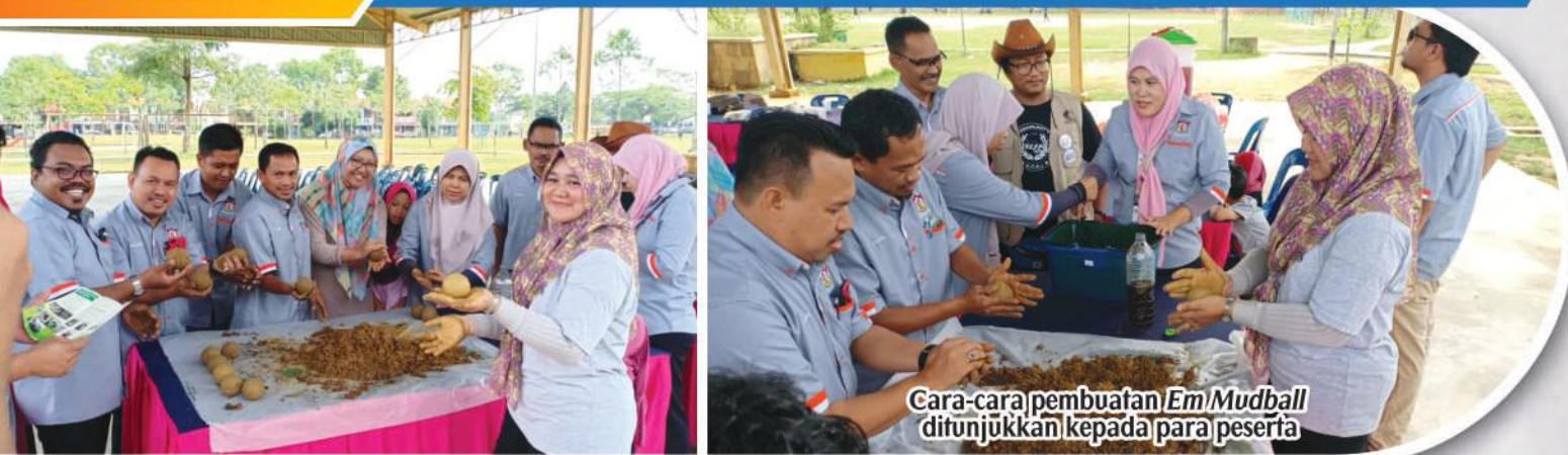
Cara-cara pembuatan Em Mudball ditunjukkan kepada para peserta

PROGRAM PEMBUATAN EM MUDBALL DI ZON SCIENTEX 1 SCIENTEX 2