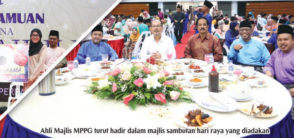
Ahli Majlis MPPG turut hadir dalam majlis sambutan hari raya yang diadakan