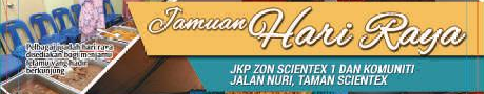
Pelbagai hidangan hari raya disediakan bagi menjamu tetamu yang hadir berkunjung

JKP ZON SCIENTEX 1 DAN KOMUNITI JALAN NURI, TAMAN SCIENTEX