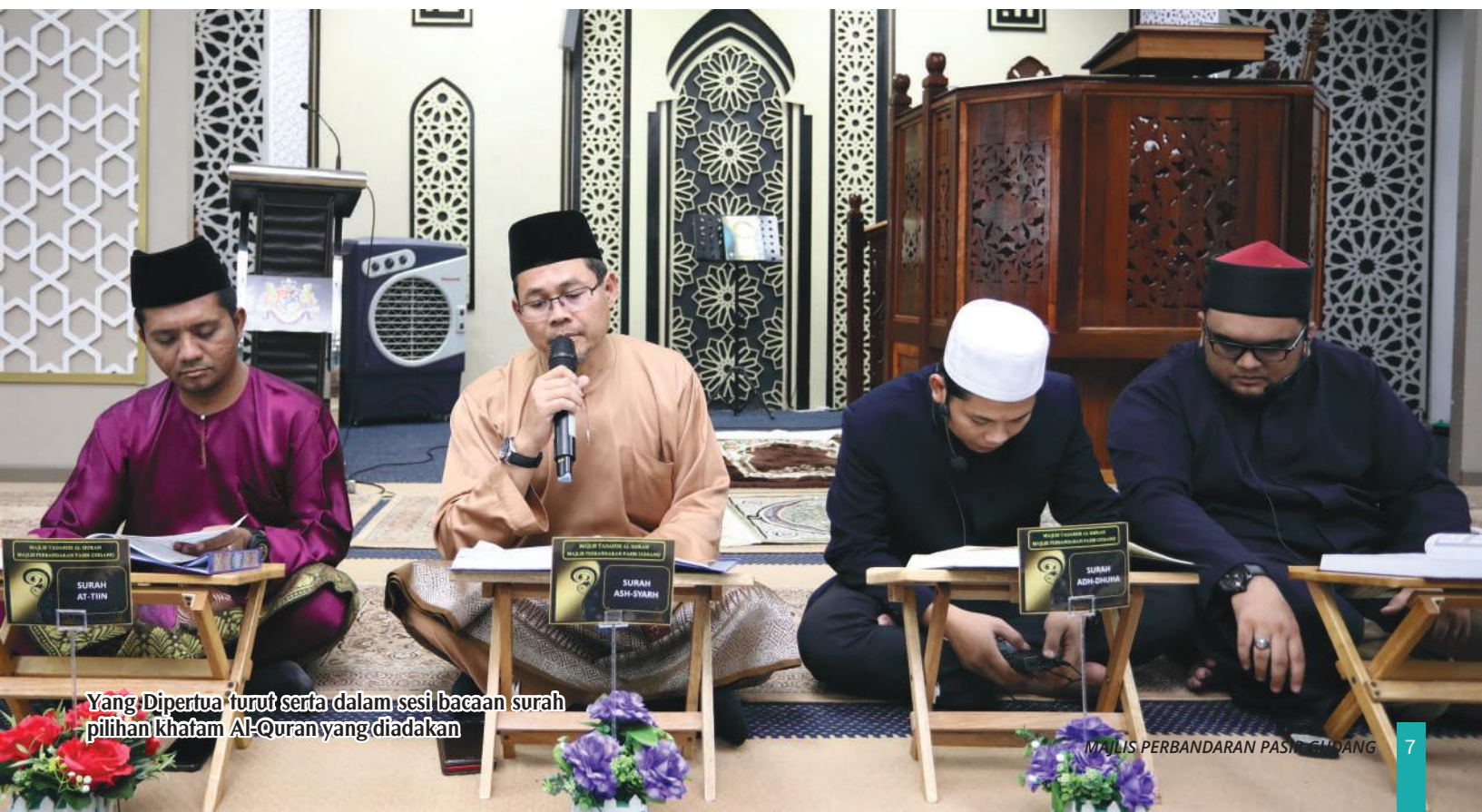
Yang Dipertua turut serta dalam sesi bacaan surah pilihan Khatam Al-Quran yang diadakan

Hadir sama dalam majlis ini, Ahli-Ahli Majlis MPPG serta jemaah masjid.