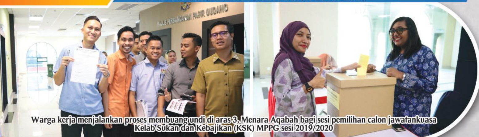
Warga kerja menjalankan proses membuang undi di aras 3, Menara Aqabah bagi sesi pemilihan calon jawatankuasa Kelab Sukan dan Kebajikan (KSK) MPPG sesi 2019/2020

HARI MENGUNDI BAGI PELANTIKAN BARU JAWATANKUASA KELAB SUKAN DAN KEBAJIKAN (KSK) MPPG SESI TAHUN 2019/2020