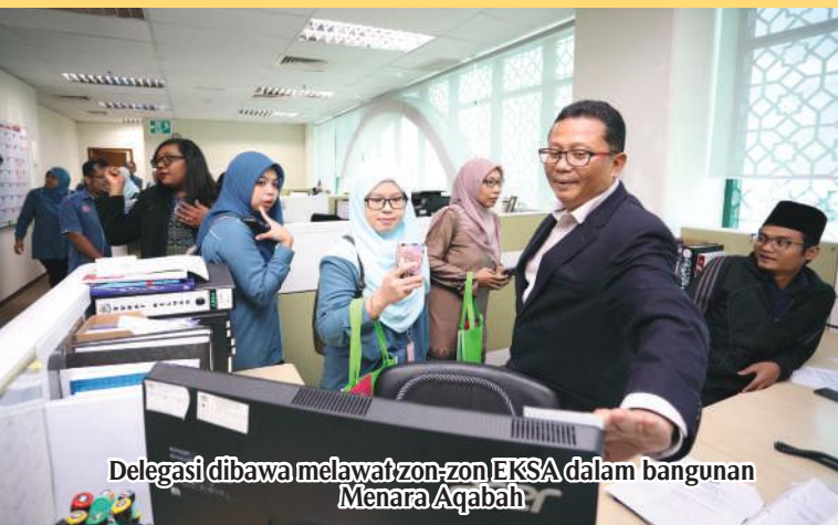
Delegasi dibawa melawat zon-zon EKSA dalam bangunan Menara Aqabah