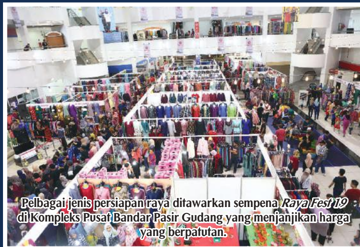
Pelbagai jenis persiapan raya ditawarkan sempena Raya Fest 19 di Kompleks Pusat Bandar Pasir Gudang yang menjanjikan harga yang berpatutan.

Antara aktiviti-aktiviti menarik yang berlangsung sepanjang program persembahan artis tempatan, pertandingan menganyam ketupat, demonstrasi masakan juadah raya, persembahan badut, persembahan qasidah, persembahan ghazal, persembahan nasyid, fashion show , dan cabutan bertuah.