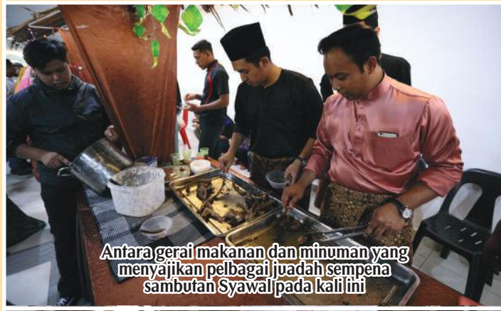
Antara gerai makanan dan minuman yang menyajikan pelbagai juadah sempena sambutan Syawal pada kali ini