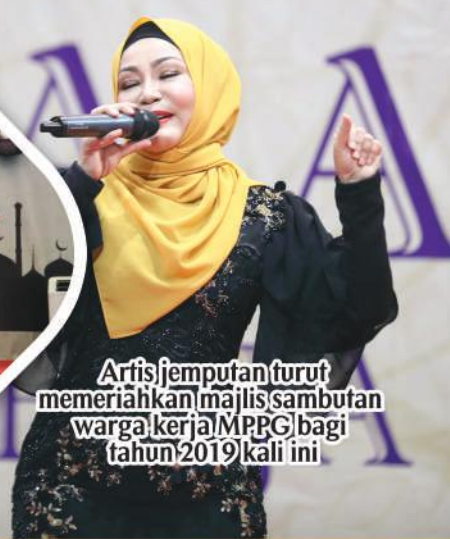
Artis jemputan turut memeriahkan majlis sambutan warga kerja MPPG bagi tahun 2019 kali ini