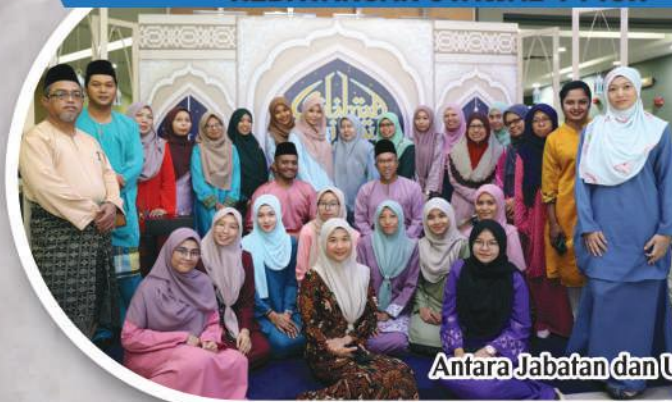
Antara Jabatan dan Unit di MPPG dalam sesi fotografi yang diadakan