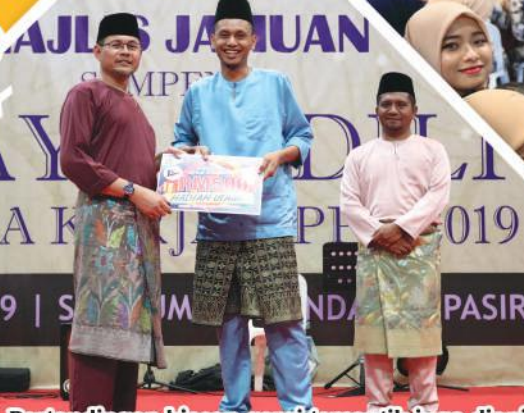
Pertandingan hiasan gerai tercantik juga dianjurkan bagi sambutan Syawal kali ini