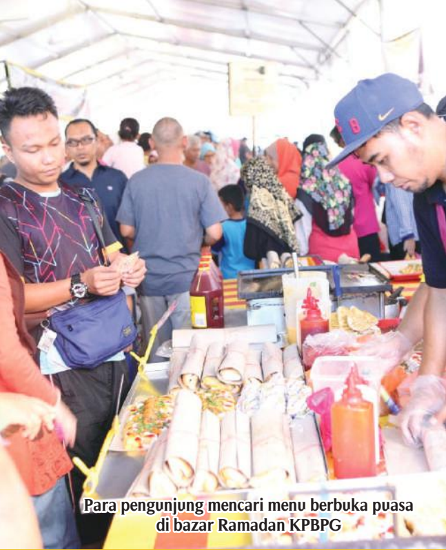
Para pengunjung mencari menu berbuka puasa di bazar Ramadan KPBPG