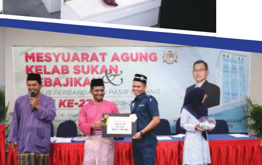
Acara cabutan bertuah turut diadakan.