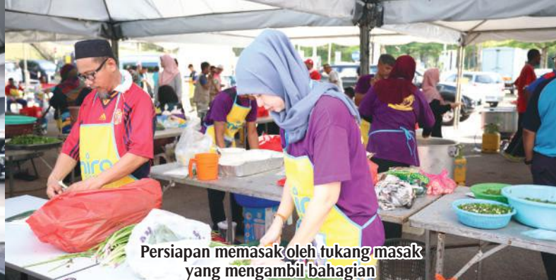
Persiapan memasak oleh tukang masak yang mengambil bahagian