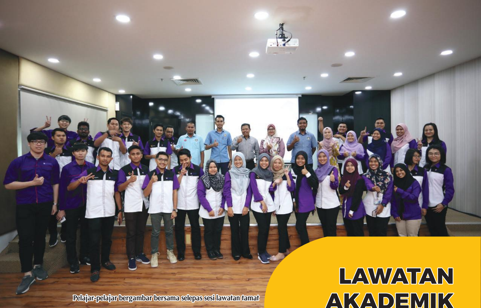
Pelajar-pelajar bergambar bersama selepas sesi lawatan tamat