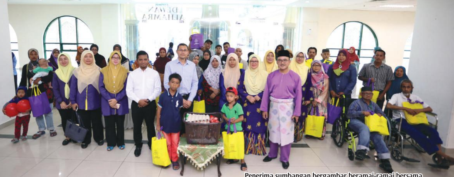
Penerima sumbangan bergambar beramai-ramai bersama Tuan Pegawai Daerah dan Yang Dipertua selepas majlis sumbangan selesai