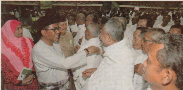
MOHAMED KHALED NORDIN (dua dari kiri) bersalam dan beramah mesra dengan bakal haji sewaktu merasmikan Kursus Perdana Haji Negeri Johor 2016 di Stadium Tertutup MPPG, Johor Bahru, baru-baru ini.