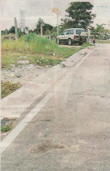
Longgokan sampah di tengah jalan telah dibersihkan oleh pihak MPPG.

Sinar Harian Isnin lalu menyiarkan kemarahan penduduk ekoran sikap am-