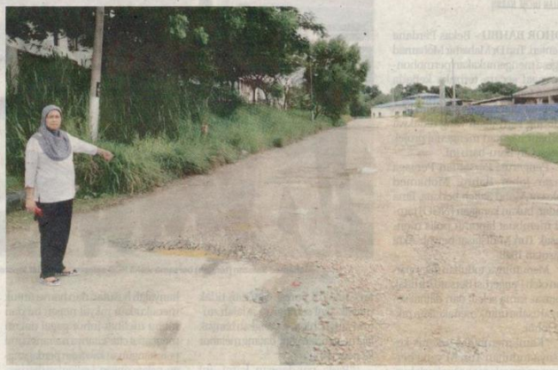
Shahriah menunjukkan keadaan jalan yang terpaksa digunakan penduduk setiap hari ke surau berhampiran.

"Cukuplah dengan beberapa kes penduduk terbasas dan terjatuh daripada motosikal selepas terlanggar lubang kerana kita tak mahu sehingga ada yang terkorban," katanya.