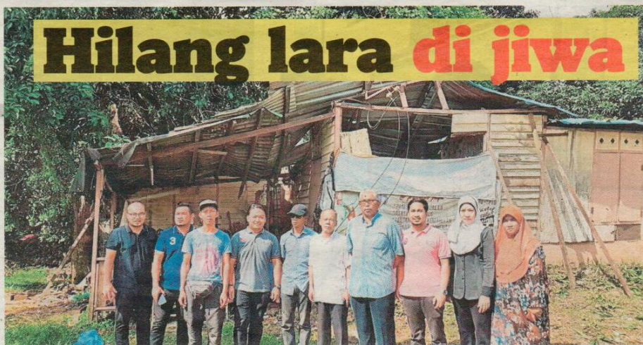
SAPERI (tiga dari kiri) menerima kunjungan Pertubuhan Ihsan Johor di rumahnya di Kampung Baru, Masai, semalam.