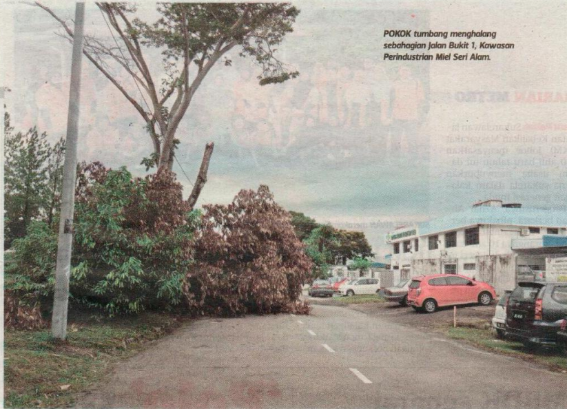
POKOK tumbang menghalang sebahagian Jalan Bukit 1, Kawasan Perindustrian Miel Seri Alam.