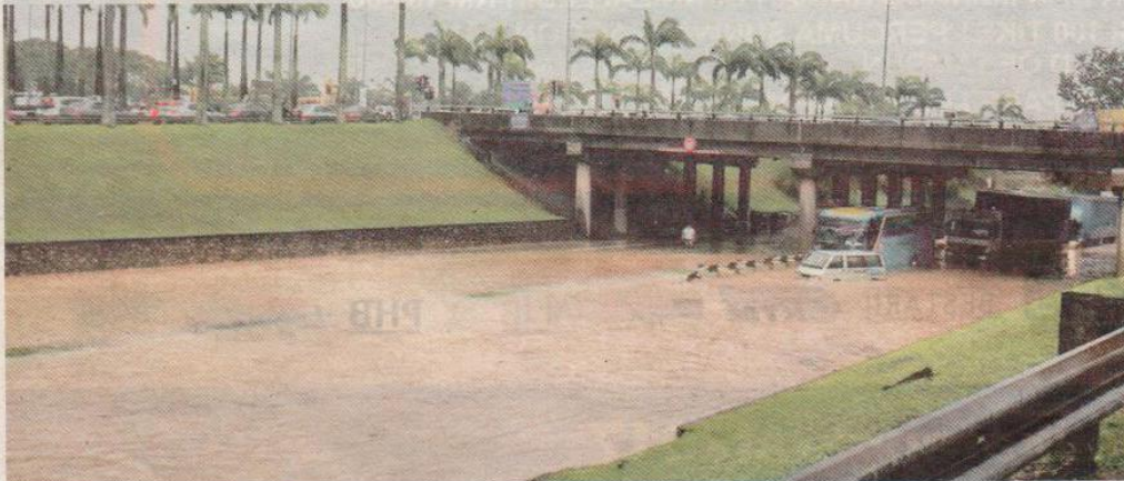
Beberapa kenderaan terperangkap akibat banjir kilat yang berlaku petang semalam.