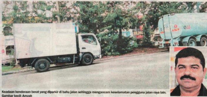
Kedudukan kenderaan berat yang diparkir di bahu jalan sehingga mengancam keselamatan pengguna jalan raya lain. Gambar kecil: Amzah

Menurutnya, situasi itu telah menyebabkan kekerapan kemalangan apabila kenderaan dari simpang keluar Taman Ria Plentong bertenbong dengan kenderaan yang melalui Jalan Masai Lama, namun be-