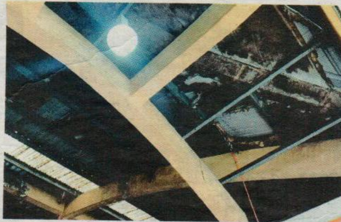
BUMBUNG bocor yang tidak diselenggara dengan baik di Pasar Awam Taman Air Biru.

“Ini rutin harian terpaksa kami lalui ketika ini. Keadaan hujan mengakibatkan bumbung bocor, sekali gus memberi kesan