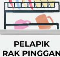
PELAPIK RAK PINGGAN