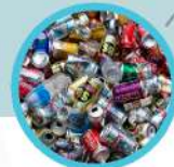
BOTOL DAN TIN