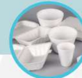
BEKAS MAKAN POLISTERIN