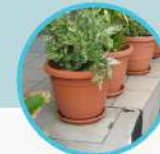
ALAS PASU BUNGA DAN PASU BUNGA