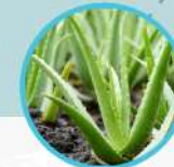
POKOK BUNGA BERKELOPAK