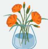
BEKAS JAMBANGAN BUNGA