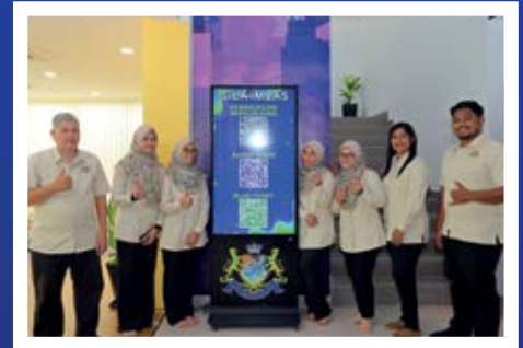
M/S 8 Majlis Perasmian Pembukaan CB Bestari.