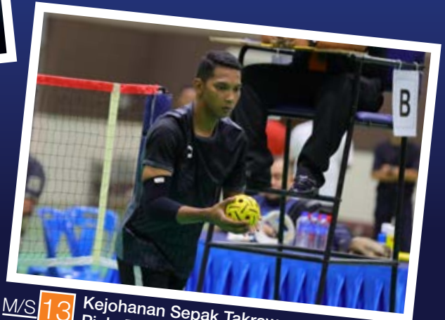
M/S 13 Kejohanan Sepak Takraw Piala Datuk Bandar Pasir Gudang.