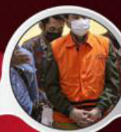
SALAH GUNA KUASA