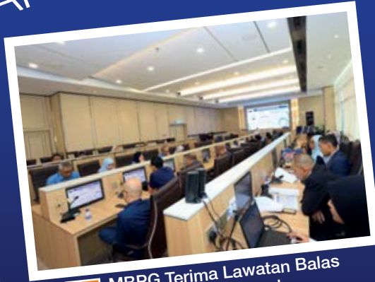
M/S 6 MBPG Terima Lawatan Balas Majlis Bandaraya Ipoh.