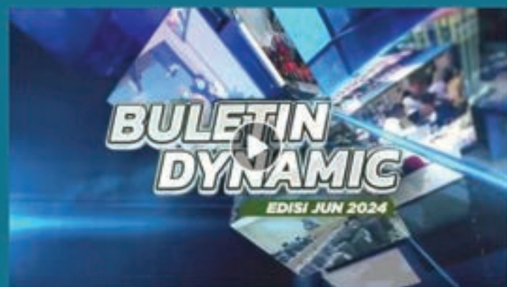
"BULETIN DYNAMIC EDISI JUN"