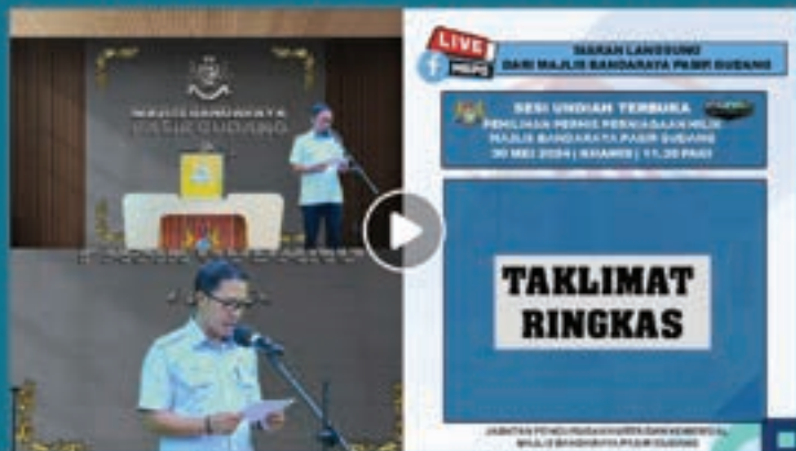
"SIARAN LANGSUNG SESI UNDIAN TERBUKA PEMILIHAN PERMIS PERNIAGAAN MILIK MBPG"