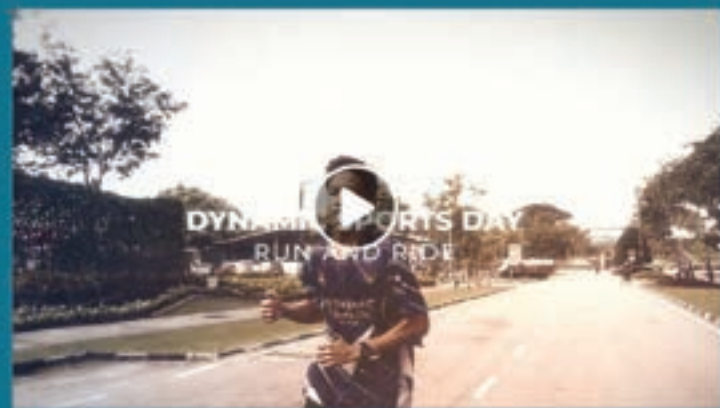
"RANGKUMAN DYNAMIC SPORTS DAY, RUN AND RIDE 2024"