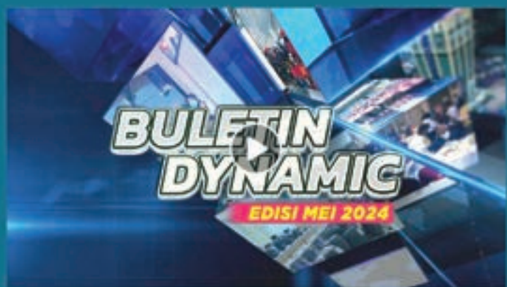
"BULETIN DYNAMIC EDISI MEI"