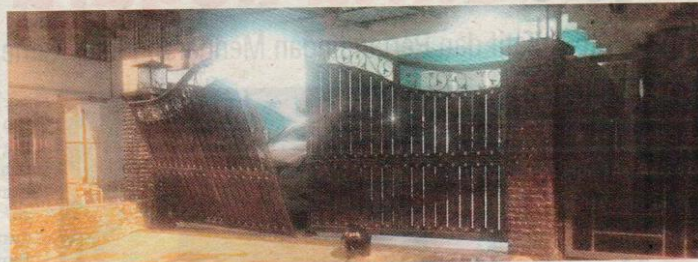
Kedadaan pagar masuk rumah salah seorang mangsa yang diumpul.

"Rumah saya adalah rumah ketiga, namun mereka tak sempat ambil apa-apa barang kerana pagar rumah saya jatuh dan bunyi kuat mungkin