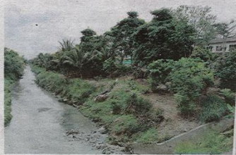
Sungai Selangkah yang berbau busuk begitu hampir dengan kediaman penduduk.