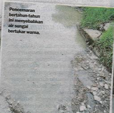
Pencemaran bertahun-tahun ini menyebabkan air sungai bertukar warna.