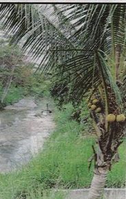
Kedaaan Sungai Selangkah yang tercemar dan mengeluarkan bau busuk.

Sementara itu, tritjana Sinar Harian ke Sungai Selangkah yang terletak dalam kawasan perumahan itu mendapati air yang mengalir di sungai berkenaan keruh dan mengeluarkan bau