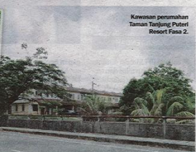
Kawasan perumahan Taman Tanjung Puteri Resort Fasa 2.