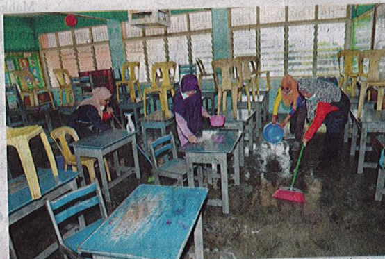
GURU-GURU dan ibu bapa Sekolah Kebangsaan Taman Pasir Putih di Pasir Gudang, Johor bergotong-royong membersihkan kelas yang dicemari sisa kimia baru-baru ini.