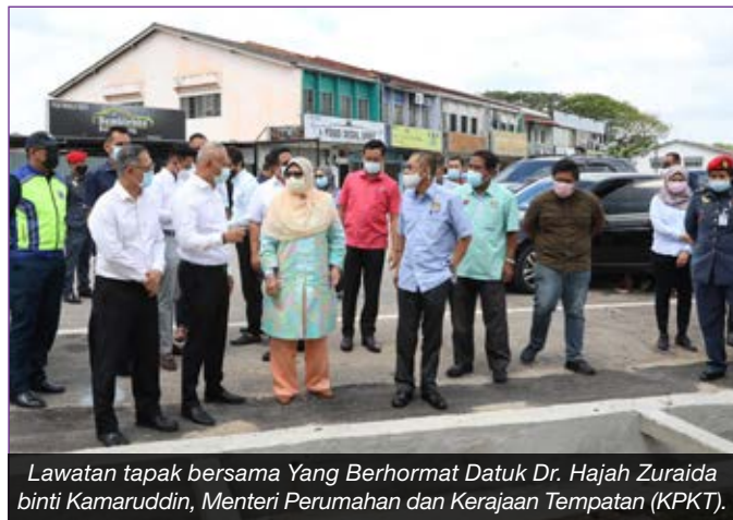
Lawatan tapak bersama Yang Berhormat Datuk Dr. Hajah Zuraida binti Kamaruddin, Menteri Perumahan dan Kerajaan Tempatan (KPKT).