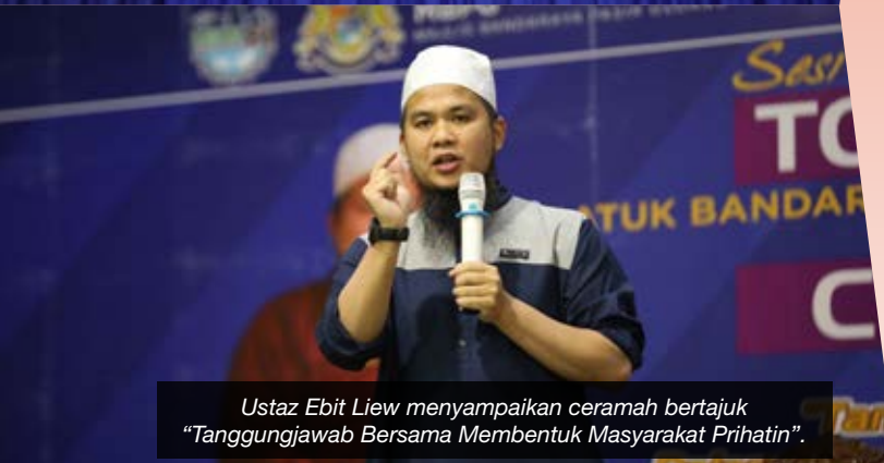
Ustaz Ebit Lew menyampaikan ceramah bertajuk "Tanggungjawab Bersama Membentuk Masyarakat Prihatin".