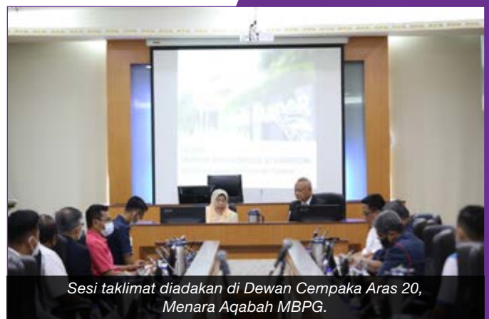
Sesi taklimat diadakan di Dewan Cempaka, Aras 20, Menara Aqabah MBPG.