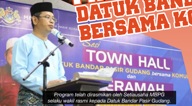
Program telah dirasmikan oleh Setiausaha MBPG selaku wakil rasmi kepada Datuk Bandar Pasir Gudang.