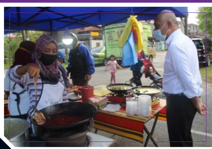
LAWATAN DATUK BANDAR KE TAPAK BAZAR RAMADAN (27/4/2021)