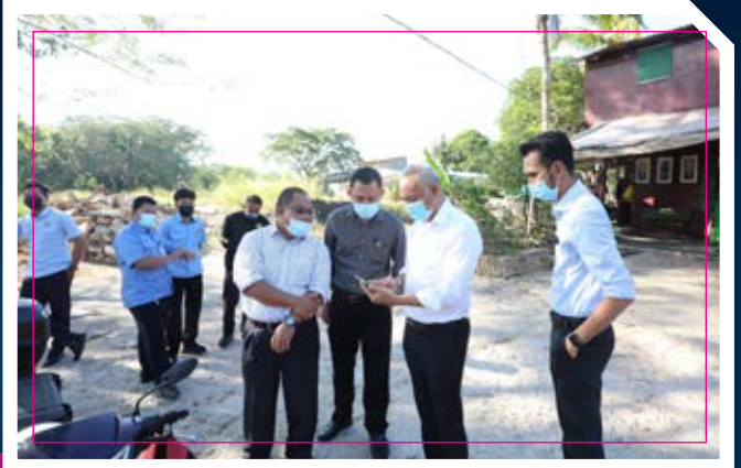
LAWATAN DATUK BANDAR PASIR GUDANG KE SUNGAI KIM KIM (8/3/2021)