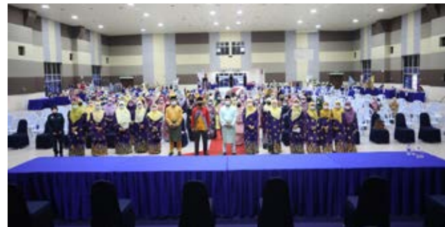
Sesi bergambar bersama Datuk Bandar Pasir Gudang setelah selesai merasmikan mesyuarat agung PUSPANITA.