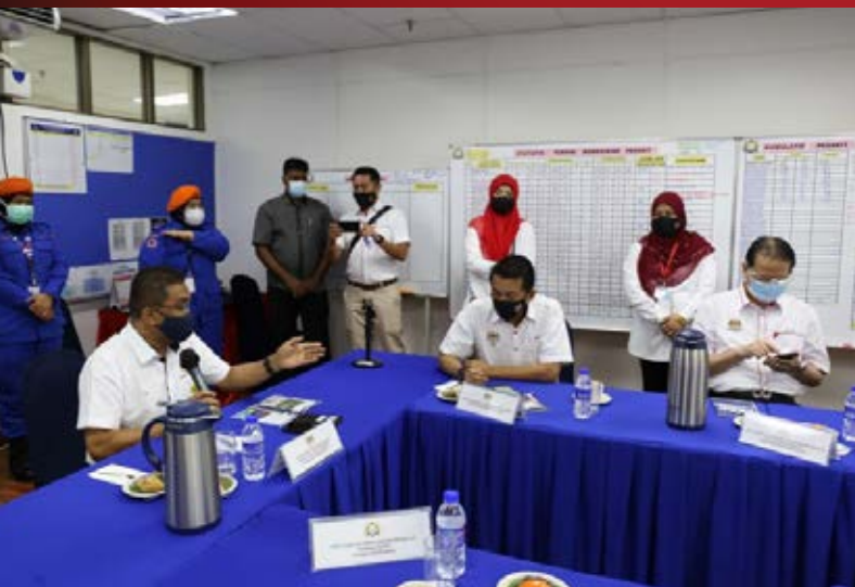
Yang Berhormat Datuk Seri Takiyuddin Hassan dalam sesi taklimat yang diadakan.

Yang Berhormat Menteri diberi taklimat ringkas mengenai maklumat dan pengurusan PKRC dan CAC Pasir Gudang, kemudiannya dibawa melawat sekitar pusat kuarantin dan rawatan ini. Beliau bersama delegasi sempat meluangkan masa menyantuni barisan frontliner yang bertugas di pusat kuarantin dan rawatan COVID-19 ini dengan beramah mesra dan memberikan kata-kata semangat untuk terus berjuang membantu melawan pandemik COVID-19 yang melanda negara ketika ini.