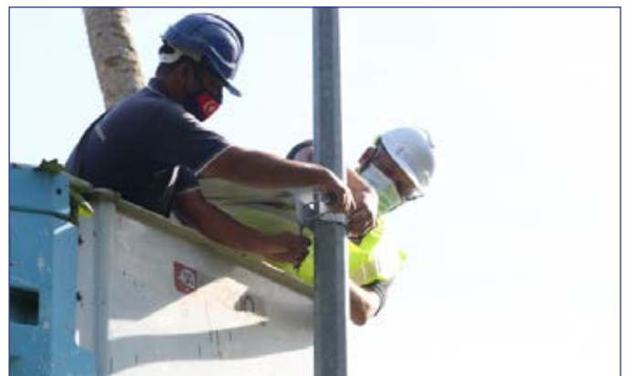
Datuk Bandar Pasir Gudang sudi meluangkan masa melaksanakan kerja-kerja memasang panel lampu solar dan membaiki pulih atap bumbung penduduk kampung Perigi Aceh.

Aktiviti riadah berbasikal bersama Datuk Bandar turut diadakan. Sepanjang program berlangsung, Datuk Bandar bersama-sama penduduk kampung telah berbasikal menelusuri kampung Perigi Aceh sambil menyantuni penduduk kampung. Program berakhir pada jam 1.00 tengahari.