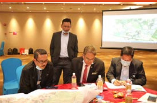
Sesi Focus Group Discussion telah dijalankan melalui 2 peringkat ; Agensi Teknikal dan Pemain Industri.