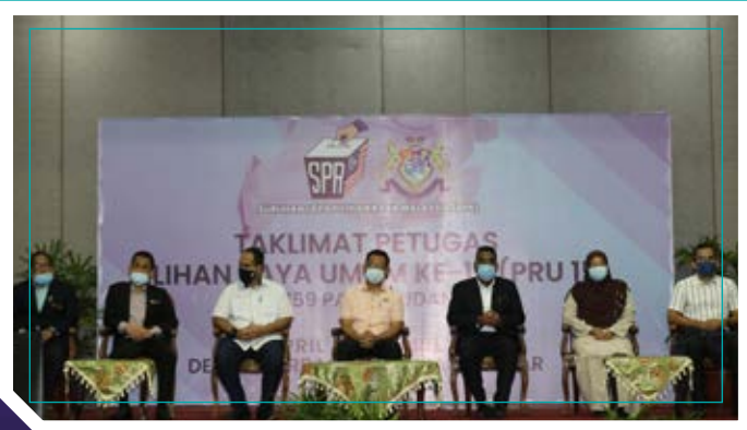
TAKLIMAT PETUGAS PILIHANRAYA UMUM KE -15 (16/4/2021)