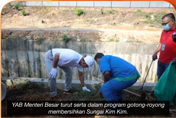
YAB Menteri Besar turut serta dalam program gotong-royong membersihkan Sungai Kim Kim.