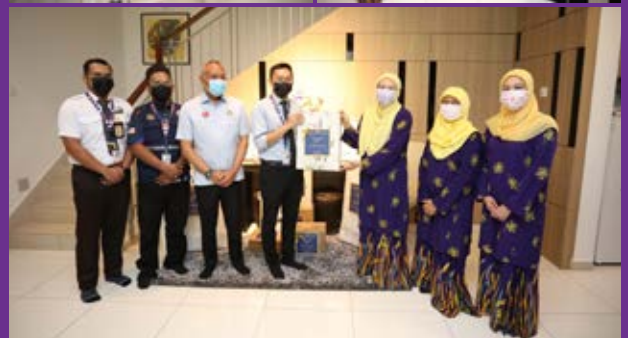
Penyampaian sumbangan telah diadakan bertempat di kediaman rasmi Datuk Bandar Pasir Gudang.