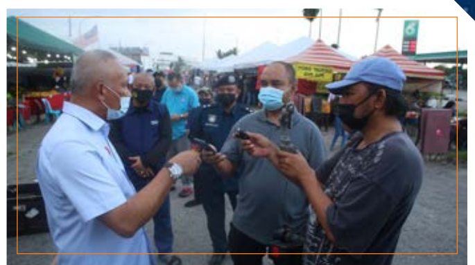
LAWATAN DATUK BANDAR KE TAPAK PENJAJA JALAN SERANGKAI TAMAN BUKIT DAHLIA (9/4/2021)