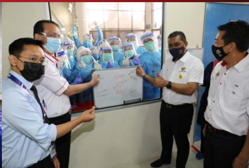
Bersama-sama barisan frontliner yang bertugas di PKRC Pasir Gudang.