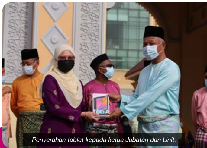
Penyerahan tablet kepada ketua Jabatan dan Unit.

Dalam program yang sama, Datuk Bandar telah menyampaikan Manifesto 100 Hari Bandaraya Pasir Gudang beliau berkaitan transformasi digital dalam memperkasakan organisasi dan menyantuni warga kerja dengan majlis serahan kemudahan tablet kepada ketua Jabatan dan Unit.