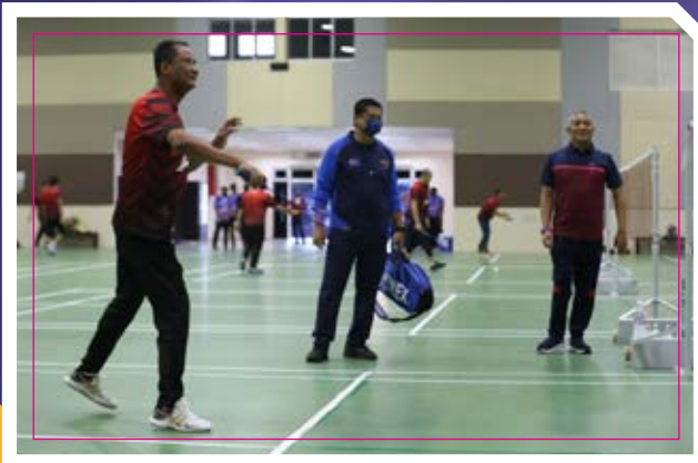
PROGRAM JOM SIHAT BERSAMA YANG BERHORMAT SETIAUSAHA KERAJAAN JOHOR (26/3/2021)