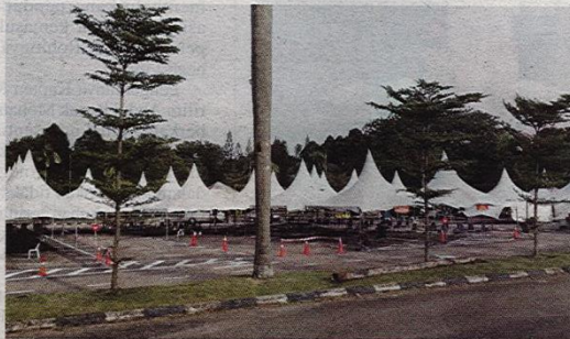
PKRC pertama di Johor iaitu di Stadium MBPG, Pasir Gudang akan beroperasi pada 10 Februari ini bagi merawat dan menempatkan pesakit Covid-19 kategori satu dan dua.

Sebuah Pusat Kuarantin dan Rawatan Covid-19 (PKRC) di negeri ini diwujudkan di Stadium Tertutup Majlis Bandaraya Pasir Gudang (MPPG) di sini bakal beroperasi 10 Februari ini.