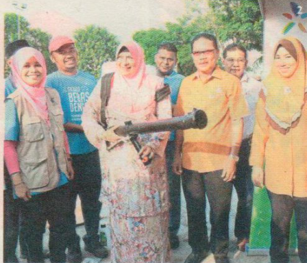
1 Taman Mawar residents including foreigners cleaning up the area during a gotong-royong programme.