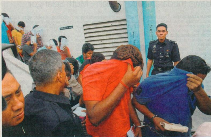
SEBAHAGIAN daripada tertuduh warga India yang mengedar dadah didakwa di Mahkamah Majistret, Johor Bahru, semalam.