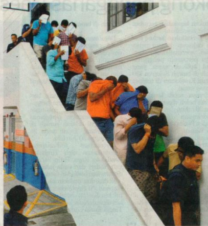
ANGGOTA polis mengawal 21 tertuduh kes dadah selepas kesemuanya didakwa di Mahkamah Majistret Johor Bahru, Johor semalam.

Kesemua tertuduh didakwa mengikut Seksyen 39B(1)(a) Akta Dadah Berbahaya (ADB) 1952 dan boleh dihukum mengikut Seksyen 39B (2) akta sama dibaca bersama Seksyen 34 Kanun Keseksan yang membawa