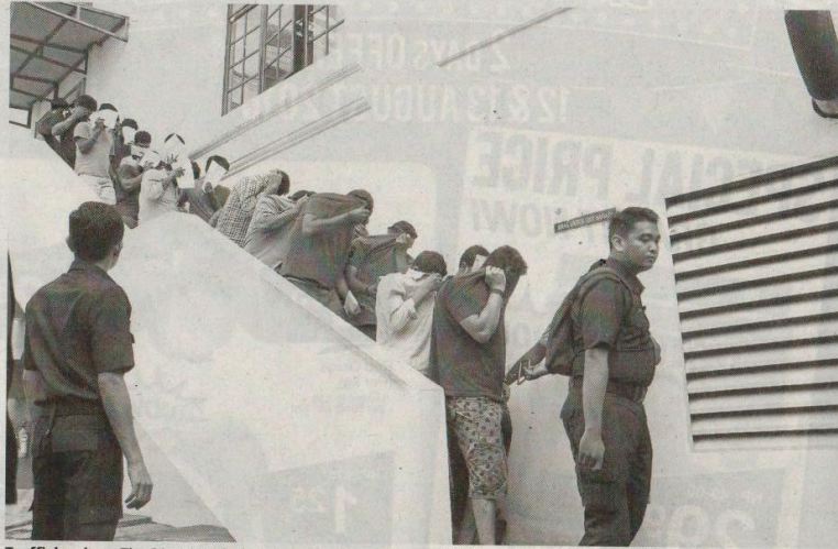
Trafficker jam: The 21 accused who were charged in the magistrate's court in Ulu Tiram being led out by police.