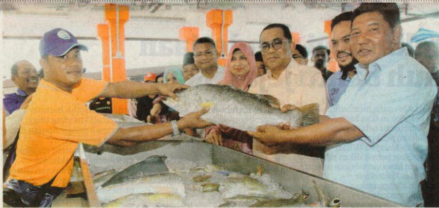
MOHAMED KHALED NORDIN (tiga dari kanan) menunjukkan antara hasil laut tangkapan penduduk yang dijual selepas merasmikan Pasar Nelayan Kg. Pasir Gudang Baru, Pasir Gudang baru-baru ini.