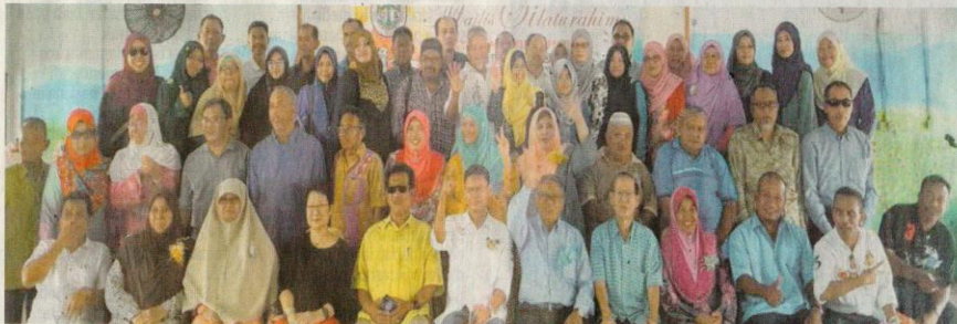
SERAMAI 120 bekas guru, kakitangan, pelajar dan keluarga dari Maktab Adabi berkumpul dalam Majlis Silaturahmi kali pertama di Dewan Mat Kilau, Kuantan semalam.

Beliau berkata, program itu merupakan sebahagian daripada persiapan akhir untuk memberi peluang kepada para pelajar mencipta kecemerlangan di peringkat sekolah menengah sebelum menghadapi peperiksaan sebenar pada awal November nanti.