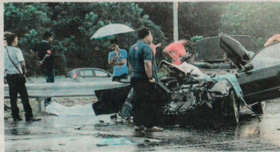
Mangsa maut di tempat kejadian selepas mengalami kecederaan parah di bahagian kepala.

"Siasatan dijalankan bawah Seksyen 41 Akta Pengangkutan Jalan 1987 dan siasatan lanjut masih diteruskan," katanya.