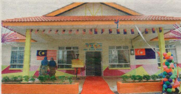
PDK Kota Masai yang dilancarkan pembukaannya semalam kini mempunyai 38 pelatih OKU yang diberi pendedahan untuk menggilap potensi diri.

Ujar beliau, pihaknya berharap pusat yang diwujudkan dapat menampung keperluan kanak-kanak OKU yang mempunyai masalah pembelajaran, fizikal, pertuturan dan pendengaran.