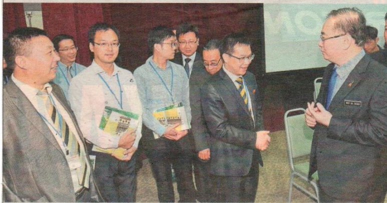
Meeting of minds: Dr Wee (right) greeting officials and speakers during the Belt and Road International Academy Forum at Southern University College, Johor Baru.