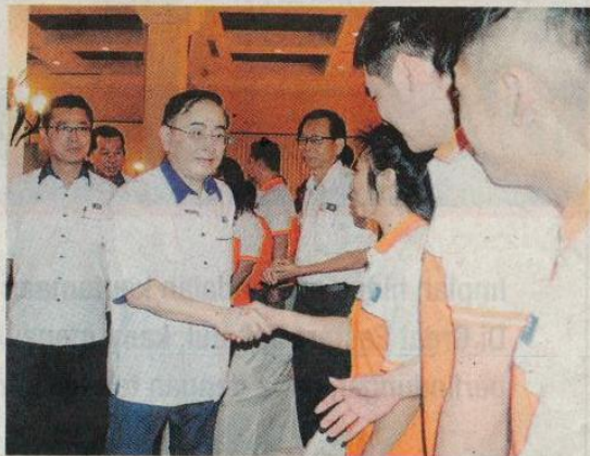
Ka Siong disambut ahli MCA Bahagian Pasir Gudang, semalam.

"Kita akan memanggil mesyuarat khas minggu depan bagi membincangkan secara terperinci kesan kajian persempadanan semula itu," katanya