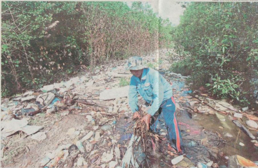
KEADAAN sisa sampah yang memenuhi Sungai Masai.

"Duit ini dapatlah untuk menambah pendapatan yang ada selain menjual kelapa hanyut dengan RMI sebiji. Jika sungai ini kotor dan bubu tiada ikan, bolehlah menampung belanja dapur," katanya.