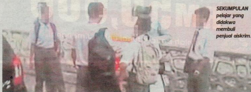
SEKUMPULAN pelajar yang didakwa membuli penjual aiskrim.

Menurutnya, keenam-enam pelajar yang lengkap beruniform sekolah termasuk seorang daripadanya menggu-