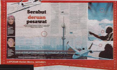
LAPORAN Harian Metro, semalam