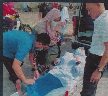
SEORANG pelajar yang mengalami sesak nafas kerana dipercayai terhidu sisa kimia dibawa masuk ke dalam ambulans untuk dihantar ke hospital di Johor Bahru, semalam.

Dua daripada mangsa iaitu seorang pelajar dan pekerja kantin SMK Taman Pasir Putih diberi bantuan pembedahan di Hospital Sultan Ismail (HSI) di