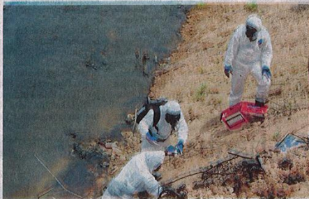
ANGGOTA dari Pasukan Unit Bahan Berbahaya (Hazmat) mengambil sampel air di lokasi pembuangan bahan-bahan sisa buangan di Sungai Kim Kim, Pasir Gudang semalam.