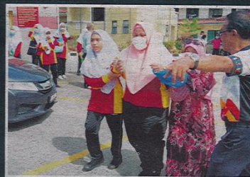
SUASANA cemas pelajar dan kakitangan Sekolah Kebangsaan Taman Pasir Putih dan Sekolah Menengah Kebangsaan Taman Pasir Putih yang mengalami sesak nafas dipercayai terhidu sisa kimia.

Terdahulu pelajar-pelajar mula mengadu terhidu bau gas dan muntah-muntah kira-kira pukul 9 pagi sebelum mereka diarahkan berkumpul