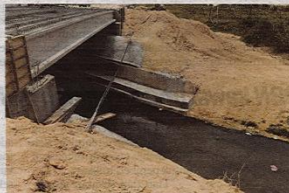
Sungai Kim Kim yang dipercayai tempat berlakunya buangan bahan kimia berkenaan.

Jabatan Bomba dan Penyelamat Malaysia (JBPM) telah meletakkan peralatan khas menyerap minyak (oil boom) di Sungai Kim Kim, Taman Pasir Putih, di sini, bagi mengawal bahan kimia yang dipercayai dibuang di sungai berkenaan agar tidak merebak.