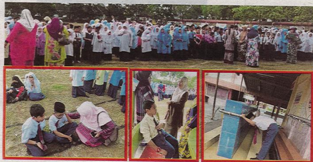
GURU dan murid berkumpul di padang sekolah selepas diberitahu ada pencemaran bau daripada bahan kimia yang melimpah di Sungai Kim Kim berdekatan dengan Sekolah Kebangsaan Taman Pasir Putih, Pasir Gudang.