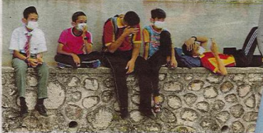
PELAJAR memakal topeng muka berikutan impohon bahan kimia di sungai berdekatan dengan Sekolah Kebangsaan Taman Pasir Putih, Pasir Gudang.

"Ketika itu, saya berasa tidak sedap hati kerana bingung bau kuat seperti bau