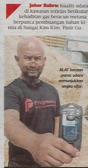
ALAT bacaan paras udara menunjukkan angka sifar.

penduduk berusaha melindungi diri dengan memakai topeng ketika berada di luar rumah mahupun ketika berada di lokasi kejadian. Penduduk dilatih memakai topeng penutup hidung kerana bimbang terhidu bau kimia dari sungai itu.