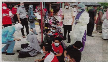
Situasi murid SK Taman Pasir Putih yang berdepan masalah kesihatan pagi semalam.

T iga individu terdiri daripada dua pemilik kilang dan seorang pekerja ditahan kerana dipercayai terlibat dengan kejadian pencemaran sisa bahan kimia ke dalam Sungai Kim Kim di sini, Kluang baru. Ketiga-tiga suspek berusia antara 40-an hingga 50-an itu, ditahan dalam