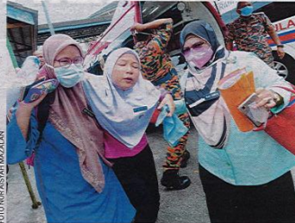
SITUASI cemas seorang pelajar diberi bantuan kecemasan akibat mengalami simptom sesak nafas selepas terhidu gas metana di SK Taman Pasir Putih dan SMK Pasir Putih semalam.

Semalam, dua buah sekolah berkenaan dibuka semula selepas diberi cuti kecemasan namun menjelang tengah hari suasana kembali panik apabila beberapa pelajar mengadu sesak nafas serta muntah-muntah. Dr. Sahrudin berkata, susulan kejadian itu, pihaknya mengarahkan semua pelajar mengosongkan bangunan. "Kontraktor telah dilantik untuk membersihkan sisa kimia di sungai berkenaan, yang memulakan kerja pembersihan hari ini (semalam). "Pembersihan dijangka mengambil masa lima hari meliputi kawasan sungai sejauh 1.3 kilometer," ujarnya.