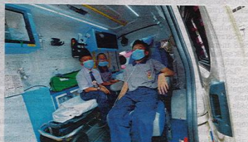
SITUASI cemas keadaan pelajar diberi bantuan kecemasan akibat mengalami simptom sesak nafas dipercayai terhidu gas sisa bahan buangan berjadual di Sekolah Kebangsaan Taman Pasir Putih, Pasir Gudang, Johor, semalam.

"Apa pun, kami amat berterima kasih kepada pihak bomba yang bertindak pantas mengarahkan penutupan semula kedua-dua sekolah berkenaan sebelum kejadian lebih buruk berlaku," katanya.