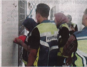
MPPG meninjau salah satu unit rumah di PPR Seri Alam yang didakwa mempunyai tunggakan sewa.

Dalam pada itu, Dzulkefly berkata, statistik PPR dan Rumah Sewa Kerajaan (RSK) menunjukkan hanya ada antara 40 hingga 45 peratus sahaja penyewa yang membayar sewa.