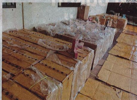
Sebahagian daripada rokok seludup yang dirampas anggota PGA Simpang Renggam di Johor pada Jumaat.

guni mercun pelbagai jenis dan sebuah lori jenis Hicom yang dipercayai digunakan dalam sindiket itu telah dirampas, dengan anggaran keseluruhan nilai rampasan berjumlah lebih RM352,350.