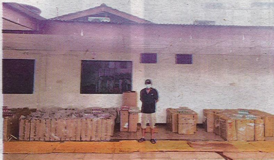
ANTARA kotak mercun dan rokok yang dirampas dalam tiga serbuan di Pasir Gudang, Muar dan Iskandar Puteri kelmarin.

"Serbuan kedua pula melibatkan penahanan dua lelaki berusia 33 dan 37 tahun di Muar dan