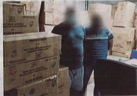
Suspek kes seludup mercun serta rokok ditahan di dua lokasi berasingan di Pasir Gudang dan Muar, semalam.

Sementara itu, di Perak, polis menahan seorang wanita warga