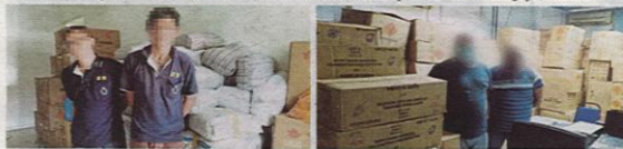
EMPAT suspek yang terlibat dalam rangkaian pengedaran mercun ditahan di dua lokasi dalam serbuan berasingan di Pasir Gudang dan Muar.