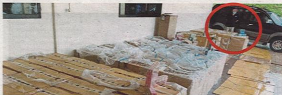
WARGA emas (gambar bulatan) ditahan bersama rokok seludup di Taman Selesa Jaya, Skudai.