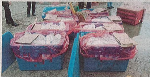
Produk kayu (gambar atas) dan ikan tanpa permit import dirampas di Pelabuhan Pasir Gudang, kelmarin.